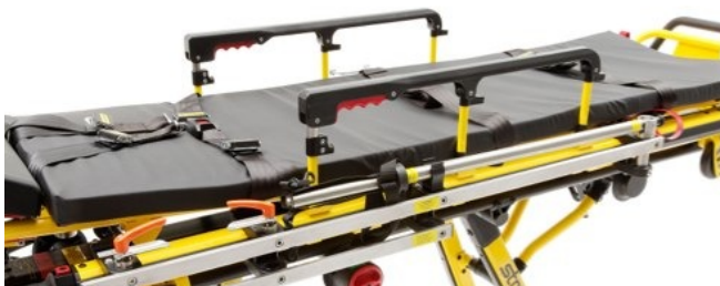
Interior GEL-AIR-TEC inovador