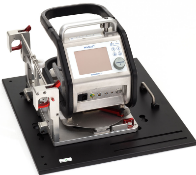
Adapterplatte für CARDIOHELP-System der Firma Maquet