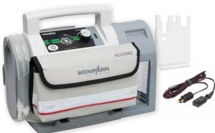
ACCUVAC Lite mit Mehrwegbehältersystem, Wandhalterung, Zubehörtasche und 12-V-Verbindungsleitung, WM 11720

Der Unterdruckbereich der ACCUVAC Lite kann durch den leicht bedienbaren Vakuumregler stufenlos eingestellt und angepasst werden. Damit kann sie sowohl bei Erwachsenen als auch bei Kindern und Kleinkindern angewendet werden. Neben der Absaugung der Atemwege kann ACCUVAC Lite auch für die Evakuierung von Vakuumschienen und -matratzen eingesetzt werden.