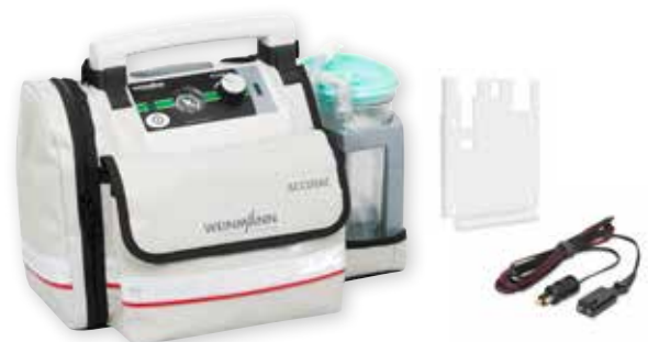
ACCUVAC Lite mit Einwegbehältersystem, Wandhalterung und 12-V-Verbindungsleitung, WM 11715 und Schutztasche WM 11692