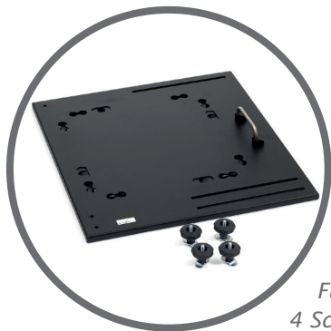
Verriegelung in zwei Airline- Schienen im Fahrzeugboden mit 4 Schraub-Fittingen